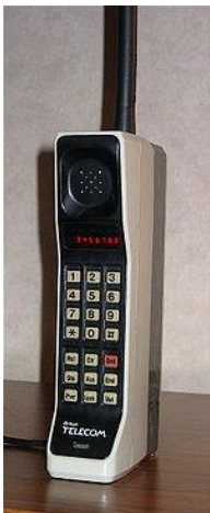
Erstes kommerzielles Mobiltelefon

Die erste überraschend exakte Beschreibung eines Mobiltelefons stammt aus dem Jahr 1932 und findet sich in Erich Kästners Kinderbuch „Der 35. Mai oder Konrad reitet in die Südsee: „Ein Herr, der vor ihnen auf dem Trottoir lang fuhr, trat plötzlich aufs Pflaster, zog einen Telefonhörer aus der Manteltasche, sprach eine Nummer hinein und rief: „Gertrud, hör mal, ich komme heute eine Stunde später zum Mittagessen. Ich will vorher noch ins Laboratorium. Wiedersehen, Schatz!“ Dann steckte er sein Taschentelefon wieder weg, trat aufs laufende Band, las in einem Buch und fuhr seiner Wege.“