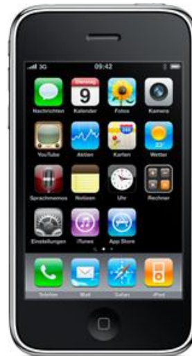
I-Phone 3G, neues Natel